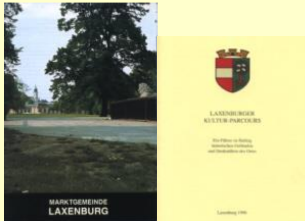
Schnell, Kunstführer Nr. 1687 und Laxenburger Kultur-Parcours

Weitere Hinweise erlaube ich mir auf zwei Druckwerke , in denen ebenfalls detailliert und umfangreich auf die Geschichte der Marktgemeinde, ihrer Gebäude und der Pfarrkirche eingegangen wird: