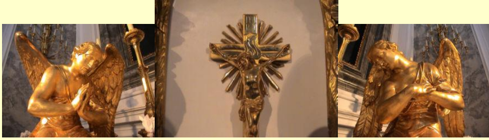
Engel links und rechts am Altar, Tabernakelkreuz