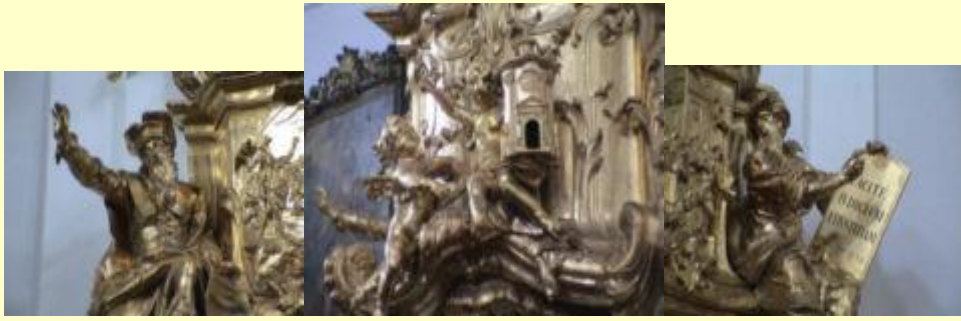
Details der Kanzel mit den links (Jesaias) und rechts (Jeremias) angebrachten Figuren zweier Propheten