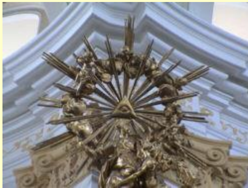
Das Auge Gottes umgeben von einem Strahlenkranz über der Kanzel