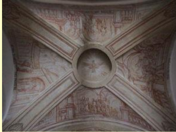
Die Kuppel im Eingangsbereich

Nun, vielleicht ist es mir gelungen, Sie etwas neugierig auf das Gebäude Kirche-Laxenburg zu machen und vielleicht kommen Sie uns einmal besuchen. Wenn Sie die Gelegenheit mit einem Besuch einer unserer Angebote in religiöser Hinsicht verbinden, werden Sie vielleicht auch neugierig auf die Institution Kirche-Laxenburg.