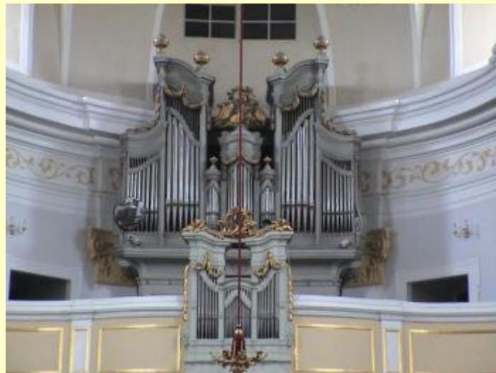
Orgel von Franz Ullmann aus 1793, erweitert 1864 (ca. 600 Pfeifen) und Chor aus 1856