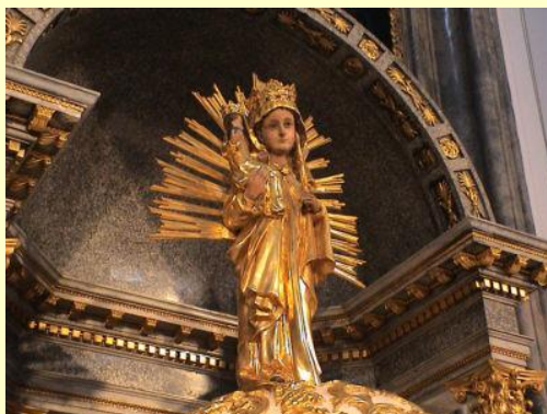
Die Altöttinger Muttergottes über dem Tabernakel