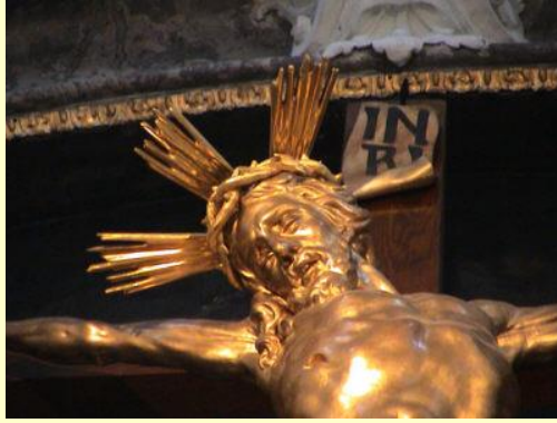
Darstellung der Kreuzerhöhung, der die Kirche geweiht ist