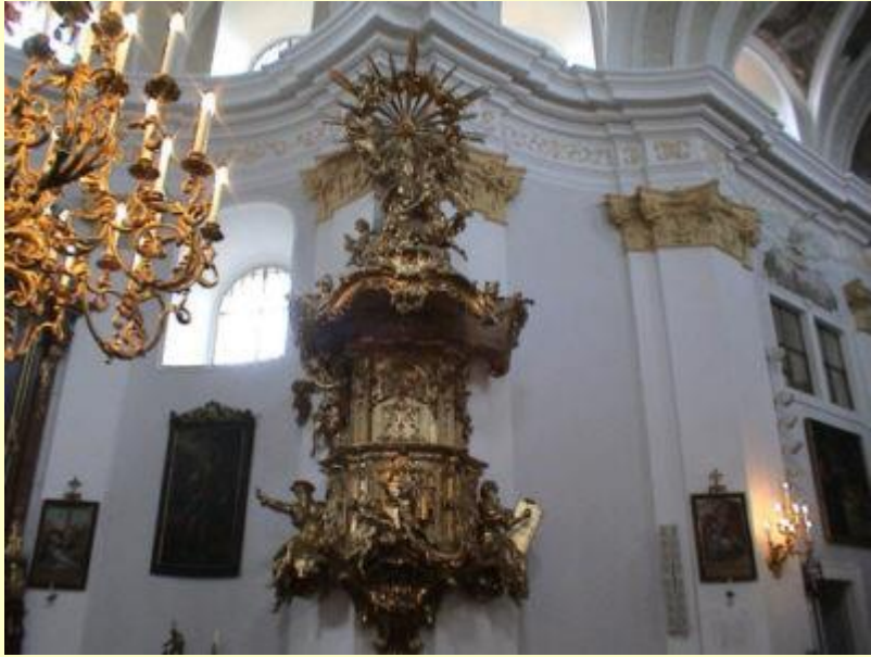
Die von J.B. Straub 1728/31 geschaffene Rokoko-Kanzel wurde 1785 hierher gebracht